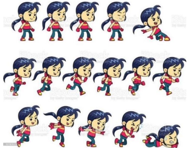
[操作キャラの画像]